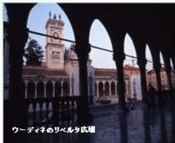
ウーディネのリベルタ広場

ヴェローナ: ヴェネト州西部に位置するヴェローナは、中世の街並みも残っている街。街の中心部には古代ローマ時代の円形競技場跡があり、街の象徴になっている。街中を流れるアディジェ川はイタリア北部を流れアドリア海に注ぐイタリアで2番目に長い川で有名。